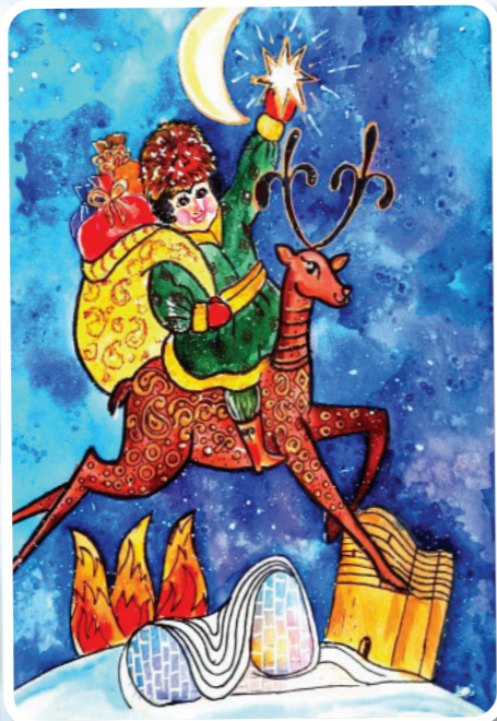
Kövsər Qurban 9 yaş