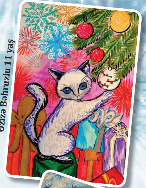
Əzizə Bəhruzlu 11 yaş