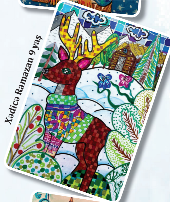
Xədicə Ramazan 9 yaş