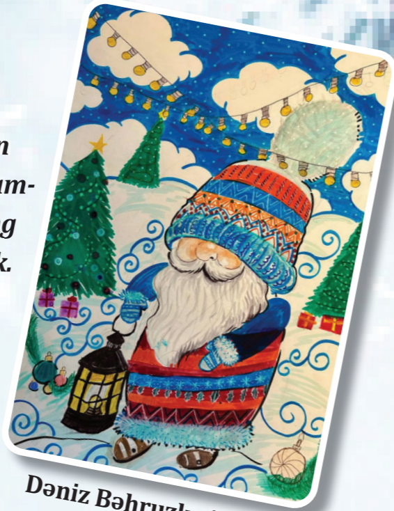
Dəniz Bəhruzlu 10 yaş