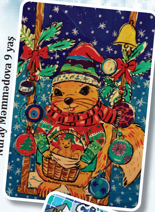
Nuray Məmmədova 9 yaş