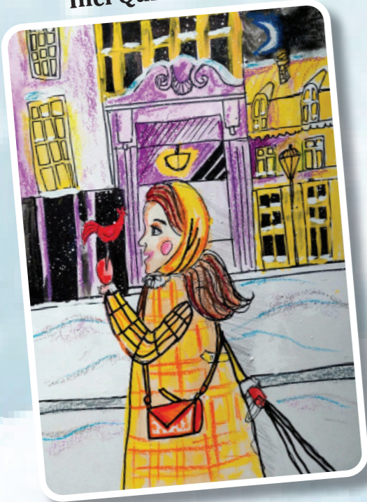
İnci Qurban 6 yaş