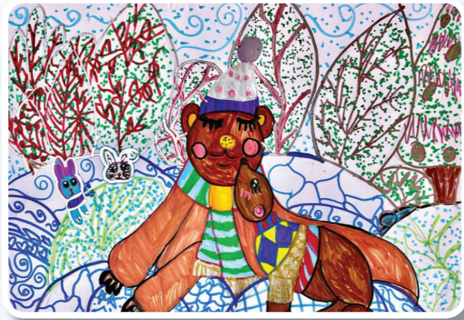
Xədicə Budaqlı 11 yaş