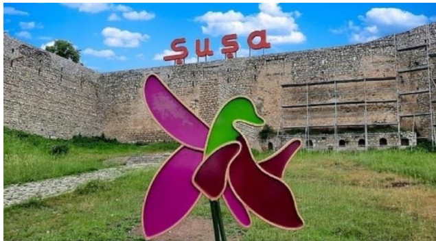
Azərbaycanın incisi, Qarabağın mirvarisi Şuşa

Şuşa Azərbaycanın ən gözəl şəhərlərindən biridir. Bu şəhərin adını bildirən “Şuşa” sözü, bu diyarın saf, qeyri-adi dərəcədə şəffaf dağ havasının rəmzi olan “şüşə” sözündəndir. Təbiət Şuşaya unikal bulaqlar və mineral sular bəxş edib. Turşsu, İsabulağı, Səkinə bulağı, İsti bulaq, Soyuq bulaq, Çarix bulaq, Saxsı bulaq, Qırx bulaq, Yüz bulaq və başqa bulaq adları bunu sübut edir. Şuşa həm də öz tarixi memarlığı ilə məşhurdur. Burada işğala qədər 129 memarlıq abidəsi yerləşirdi.