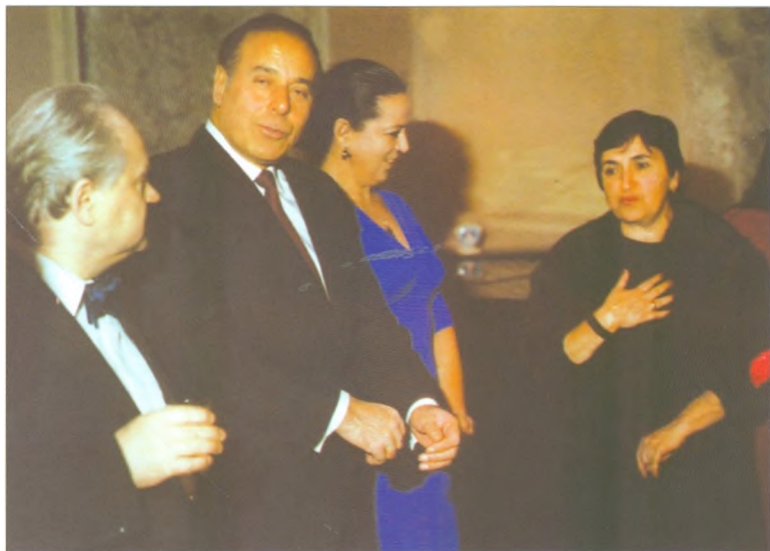
Zərifə və Heydər Əliyevlər Rusiyada Azərbaycan musiqi mədəniyyəti xadimlərini qəbul edir, 1981-ci il.