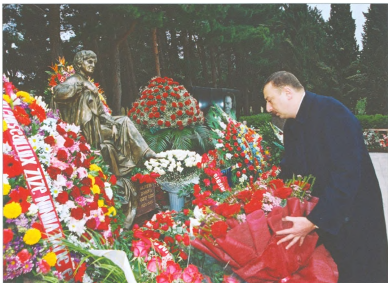
Azərbaycan Respublikasının Prezidenti İlham Əliyev anasının məzarı önündə.