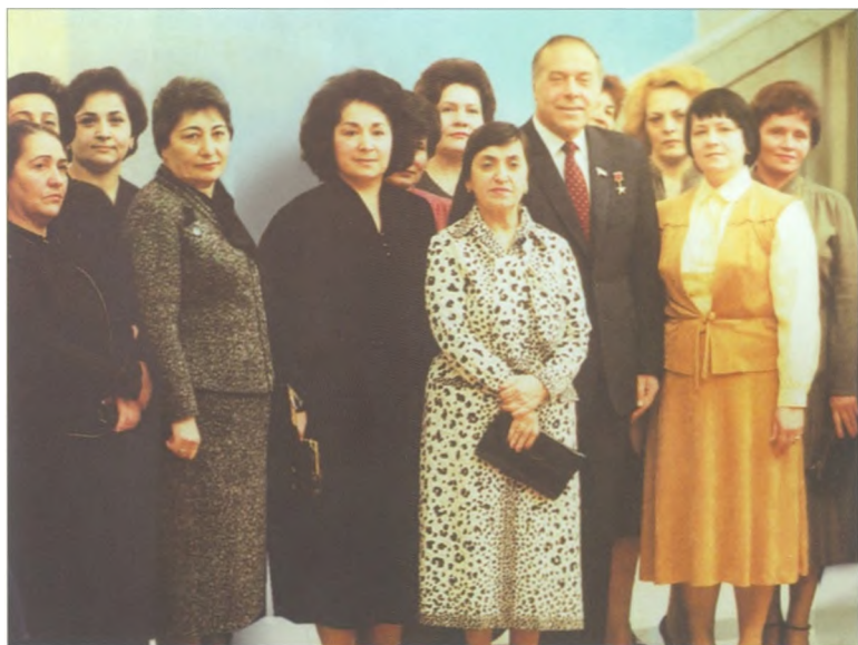
Zərifə və Heydər Əliyevlər respublika alimləri ilə, 1982-ci il.