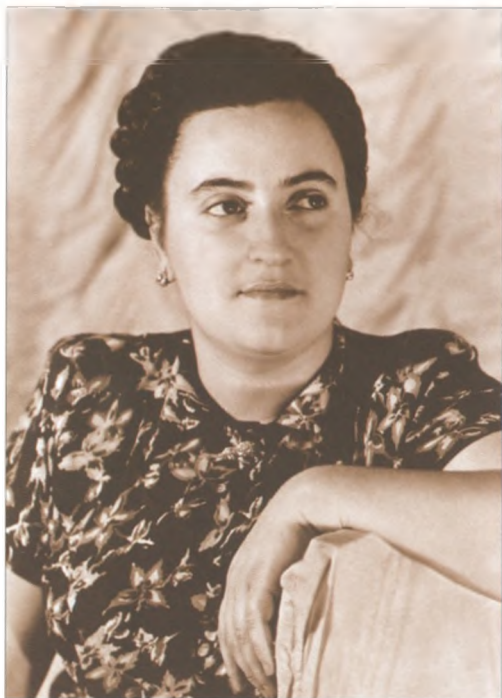
Zərifə xanım Əliyeva, 1952-ci il.