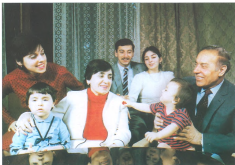
Zərifə və Heydər Əliyevlər ailəsi ilə, 1983-cü il.