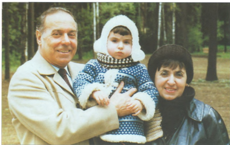
Zərifə və Heydər Əliyevlər nəvələri Zərifə ilə, 1982-ci il.