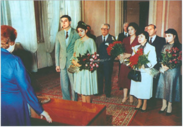
İlham Əliyev və Mehriban xanımın nişanı, 1982-ci il.