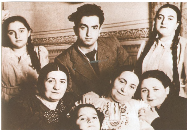
Əziz Əliyevin ailəsi, 1947-ci il.