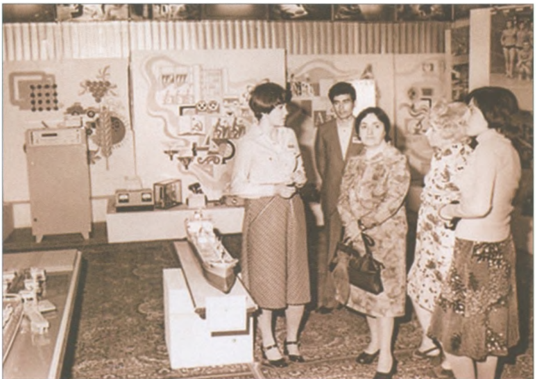
Zərifə xanım Əliyeva XTNS-də, Moskva, may 1977-ci il.