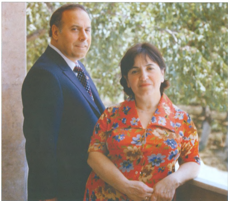
Zərifə və Heydər Əliyevlər, 1984-cü il.