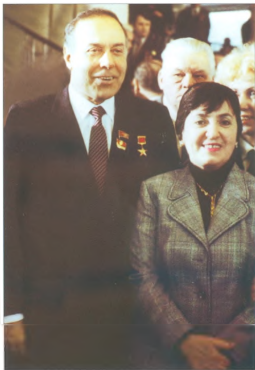
Zərifə və Heydər Əliyevlər, 1981-ci il.