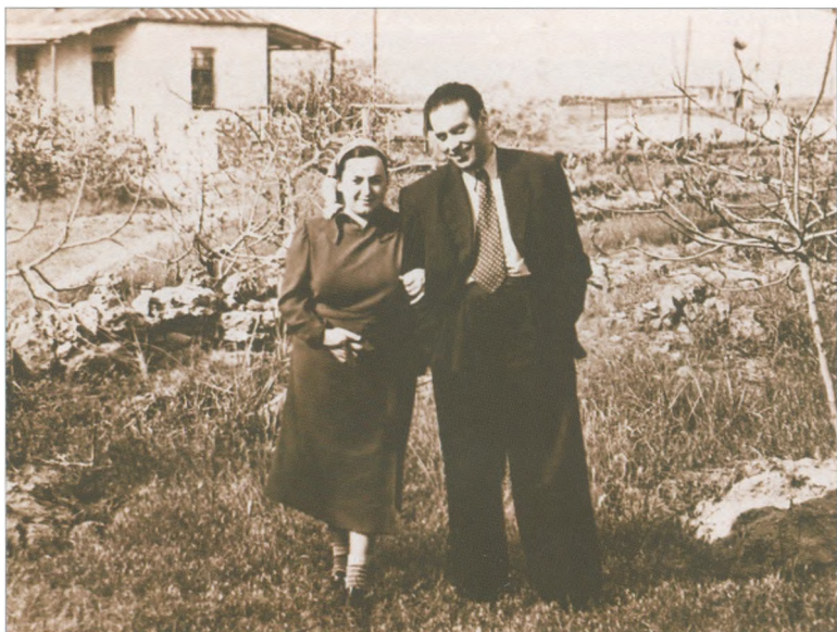
Zərifə xanım və Heydər Əliyev bağda, 1955-ci il.