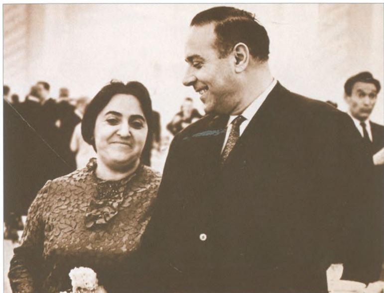
Zərifə xanım Əliyeva və Heydər Əliyev oftalmoloqlar konfransında, oktyabr 1977-ci il.