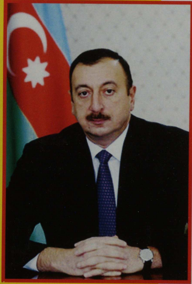
Azərbaycan Respublikasının Prezidenti İlham Əliyev

Əziz balalar, bu il Azərbaycan Respublikasının Prezidenti cənab İlham Əliyevin sərəncamı ilə "Ekologiya ili" elan edilmişdir. Məlumat üçün xatırladıq ki, "eko" yunan sözü olub, mənası məskən, vətən anlamına gəlir.