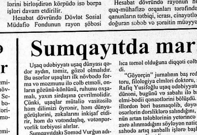
Rayonun inkişafı üçün əhəmiyyətli işlər aparılır. Programda nəzərdə tutulan işlər mərkəzlərdə kitabxanalarla təqdim olunan məhsullarla həyata keçirilir.