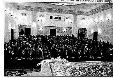
Rayonun inkişafı üçün əhəmiyyətli işlər aparılır. Programda nəzərdə tutulan işlər mərkəzlərdə kitabxanalarla təqdim olunan məhsullarla həyata keçirilir.