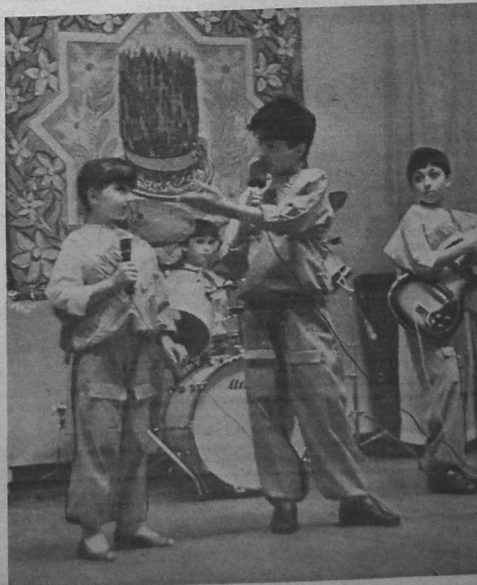
Эти снимки сделаны в Доме культуры ИБНЗ имени

В заключение — праздничные и дружбы юные ленинцы смотрели мультипликационные фильмы. Этот день надолго запомнится ребятам.