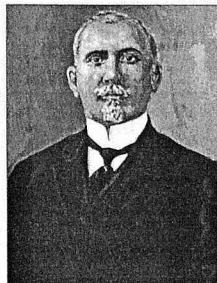
"Fırıldun bəy Köçəri". Rəssam Mahmud Tağıyev

Həmin kitab isə onunçün ələ istəkl balası mərtəbəsində idi.