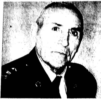
Şamistən Nazirli istefada olan polkovnik-leytenant