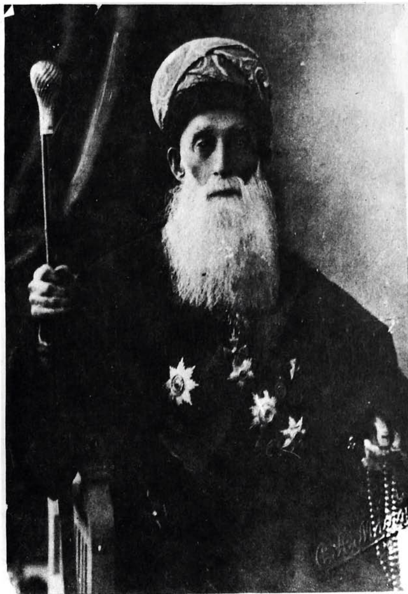
Шәкил 1. Мирзә Һүсәјн әфәнди Гајыбзадә (1830—1917).

Мирзә Һүсәјн хырдача ағ саггалына әл кәздириб алныны өвкәләди. Нә исә хатырламаға, јадына кәтирмәјә чалышырды. Көксүнү өтүрүб: