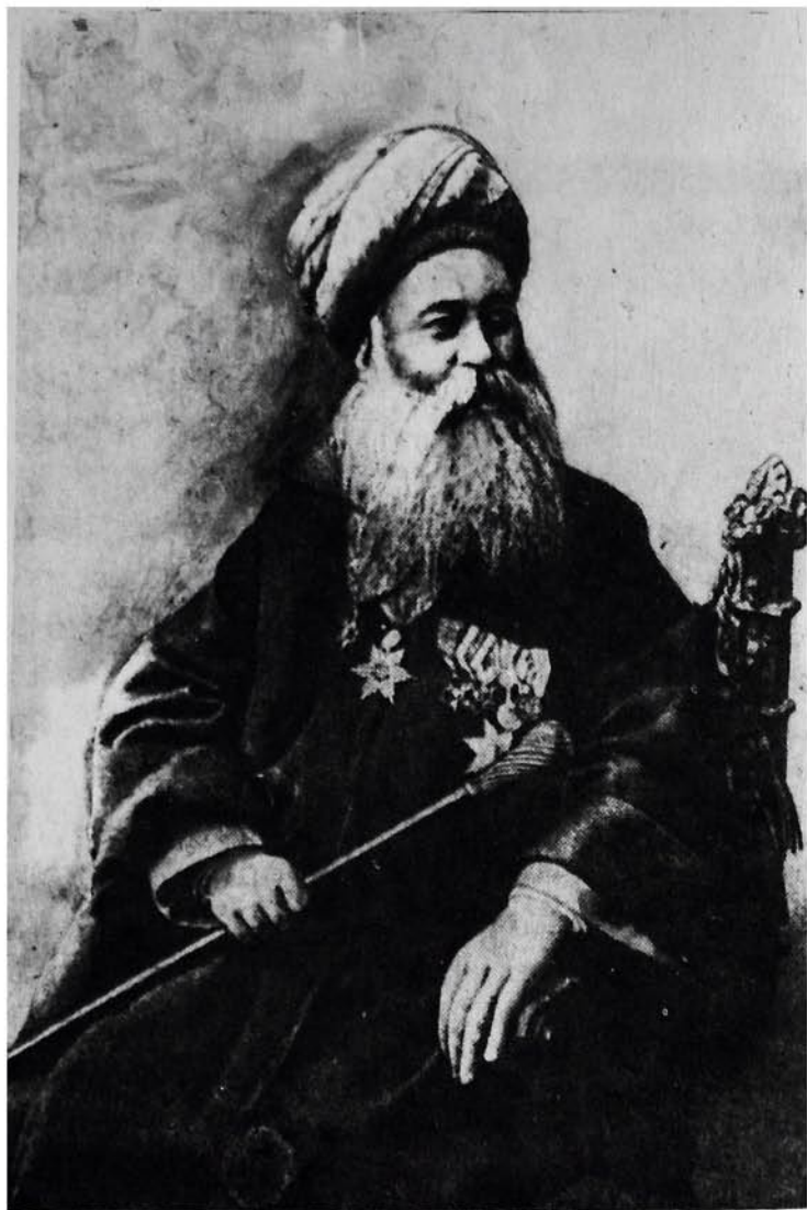
Шәкил 2. Загафгазија Шейхул исламы Әбдүссәлам Ахундзаде (1843—1907).