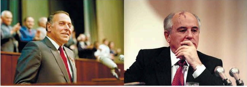
Siyasi büronun iclası

O zaman Sovetlər ölkəsində böyük nüfuzə malik, SSRİ Nazirlər Soveti Sədrinin 1- ci müavini, Sovet İttifaqı KP MK – nin büro üzvü Heydər Əliyevin həmin vəzifədə olduğu, eləcə də, Azərbaycana rəhbərlik etdiyi əvvəlki illərdə erməni millətçiləri nankorluq nümunəsi olan bu niyyətlərini qabartmağa cəsarət etmədilər. İttifaq rəhbərliyində obyektiv və prinsipial mövqeyi ilə seçilən Heydər Əliyev, idarəçilik mexanizmi tənəzzülə uğramaqda olan Qorbaçovun da yaralı yeri idi və mahiyyət etibarlı ilə daşnakların məqsədi ilə üst-üstə düşürdü. O, Hələ Stavropol vilayətində işlədiyi dövrlərdən erməni mafiyasının sifarişi ilə üzərinə götürdüyü öhdəliklər sayəsində yüksəltdiyi rəhbər vəzifəni, onunla müqayisə olunmaz qüruru və işgüzar nüfuzu ilə fərqlənən, idarəçilikdə yol verdiyi səhvləri büronun iclaslarında üzünə çıxıran Heydər Əliyev şəxsiyyətinin zəhmindən və tutduğu vəzifəni uduzmaq təhlükəsindən ehtiyat edirdi. Ona görə də Heydər Əliyevin hansı yolla olursa olsun vəzifəsindən istefa verməsinə nail olmaqla yanaşı, həm də Azərbaycan Respublikası KP MK-nin 1-ci katibi başda olmaqla DİN, MTN və digər mühüm nazirlik