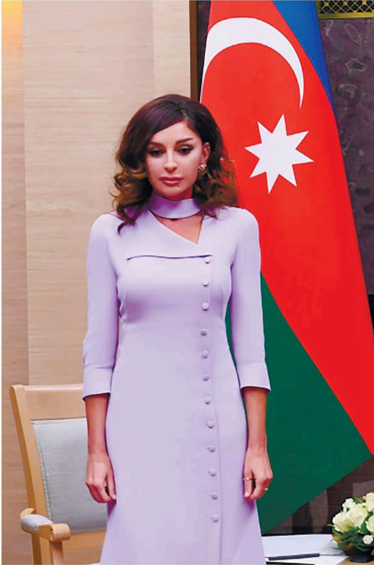
Azərbaycan Respublikasının Birinci vitse-prezidenti Mehriban Əliyeva