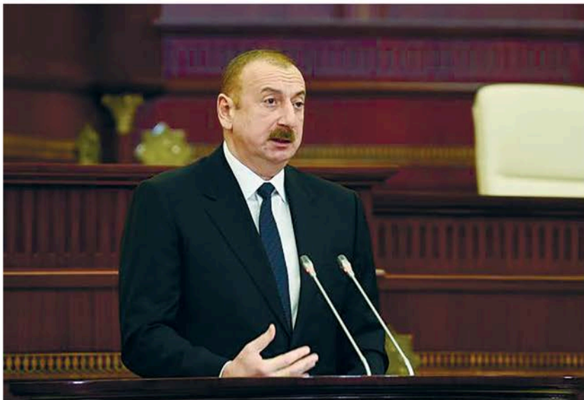
İlham Əliyevin Milli Məclisdə çıxışı

dövlət başçısını da öz vətəndaşına yaxınlaşdırırdı. Bundan irəli gəlir ki, İlham Əliyevin əhali ilə efir ünsiyyəti zamanı istifadə etdiyi bu cür ifadələr hər kəsin dilində əzbərə çevrilmiş, sitat elementi olmuşdu.