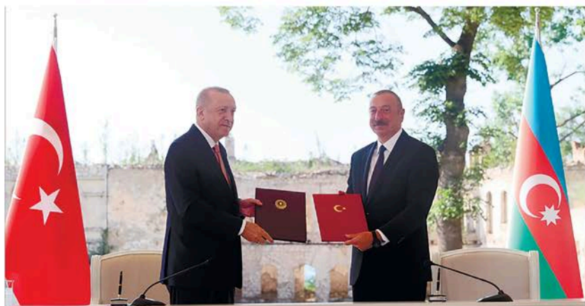
Türkiyə – Azərbaycan qardaşlığı əbədidir! Tarixi Şuşa bəyannaməsi