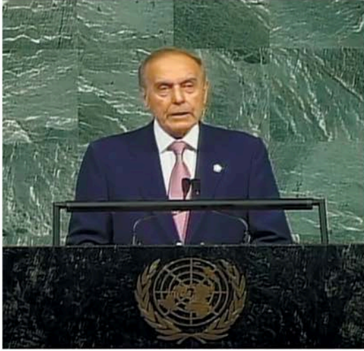
Heydər Əliyevin BMT-də çıxışı

tin ört-basdır edil-məsinə, ağ yalan və iftiraların isə ayaq tutub yeriməsinə gətirib çıxarmışdı.