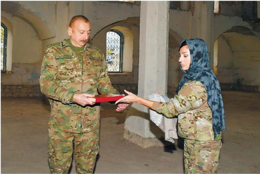
Vətən uğrunda əməllərimiz müqəddəsdir