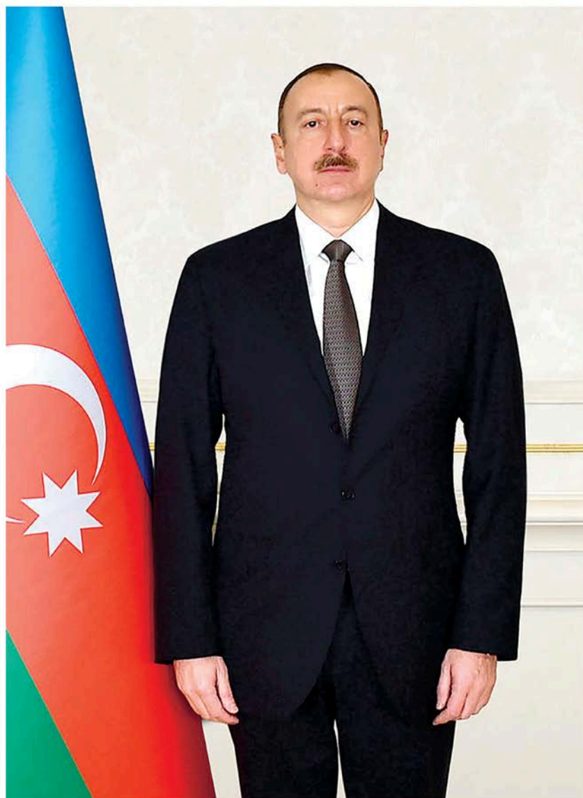
Azərbaycan Respublikasının Prezidenti İlham Əliyev