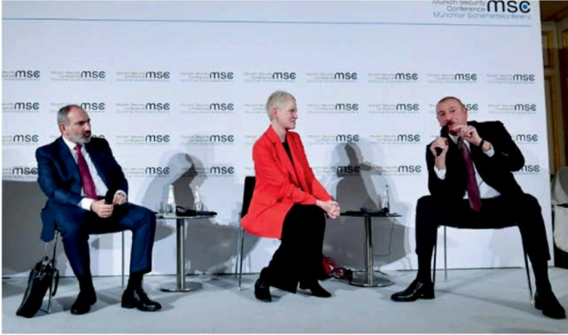
İlham Əliyevin Münxendə növbəti siyasi qələbəsi, 15 fevral 2020-ci il

sığınacaqlar qurmuş, müxtəlif növ silahlar, tanklar, hərbi maşınlar, təyyarələr, raket qurğuları və s. əldə etmişlər.