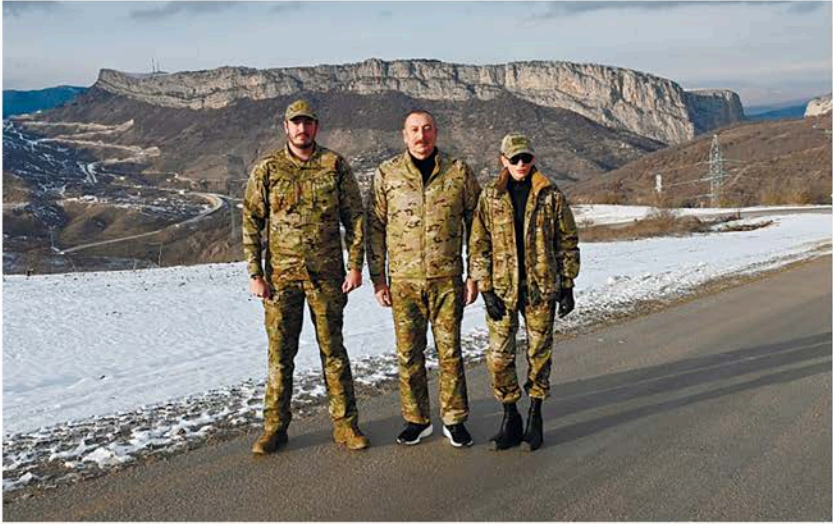
Zəfər Günü Şuşada