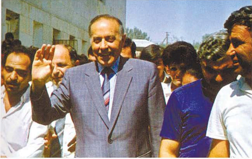
Heydər Əliyev – Naxçıvanda, iyun 1991-ci il

Bakiya gəldi və ilk vaxtlarda səhhəti ilə bağlı anadan olduğu Naxçıvanda yaşamağa və işləməyə üstünlük verdi.