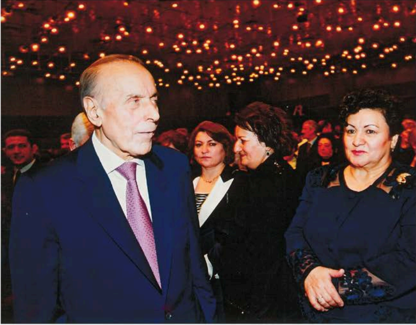
Heydər Əliyev 28 May Respublika Günü Bakı, Gülüstan sarayı, 27 may 2001-ci il

nin möhkəmlənməsi, xalqının gələcək xoşbəxtliyi və rifahı naminə canından keçməyə hazır olan Dahi rəhbər xalqının ümidini qırmadı və Bakıya gəldi. Qısa müddət ərzində mövcud problemlərin hər birini dərinlən öyrəndi. Bu problemlərin həlli gecikdirilmədən təxəssəslənən tədbirlər görülməsini tələb etdiyindən idarəçilikdə təcrübəsi olan siyasi bilik və bacarığına etibar edə biləcəyi təcrübəli kadrlara böyük ehtiyac var idi. Lakin, son on ildən çox müddət ərzində obyektiv səbəblərdən respublikanın idarəçilik sistemində mövcud kadr ehtiyatları barədə kifayət qədər məlumatlı olmayan Heydər Əliyev həmişə