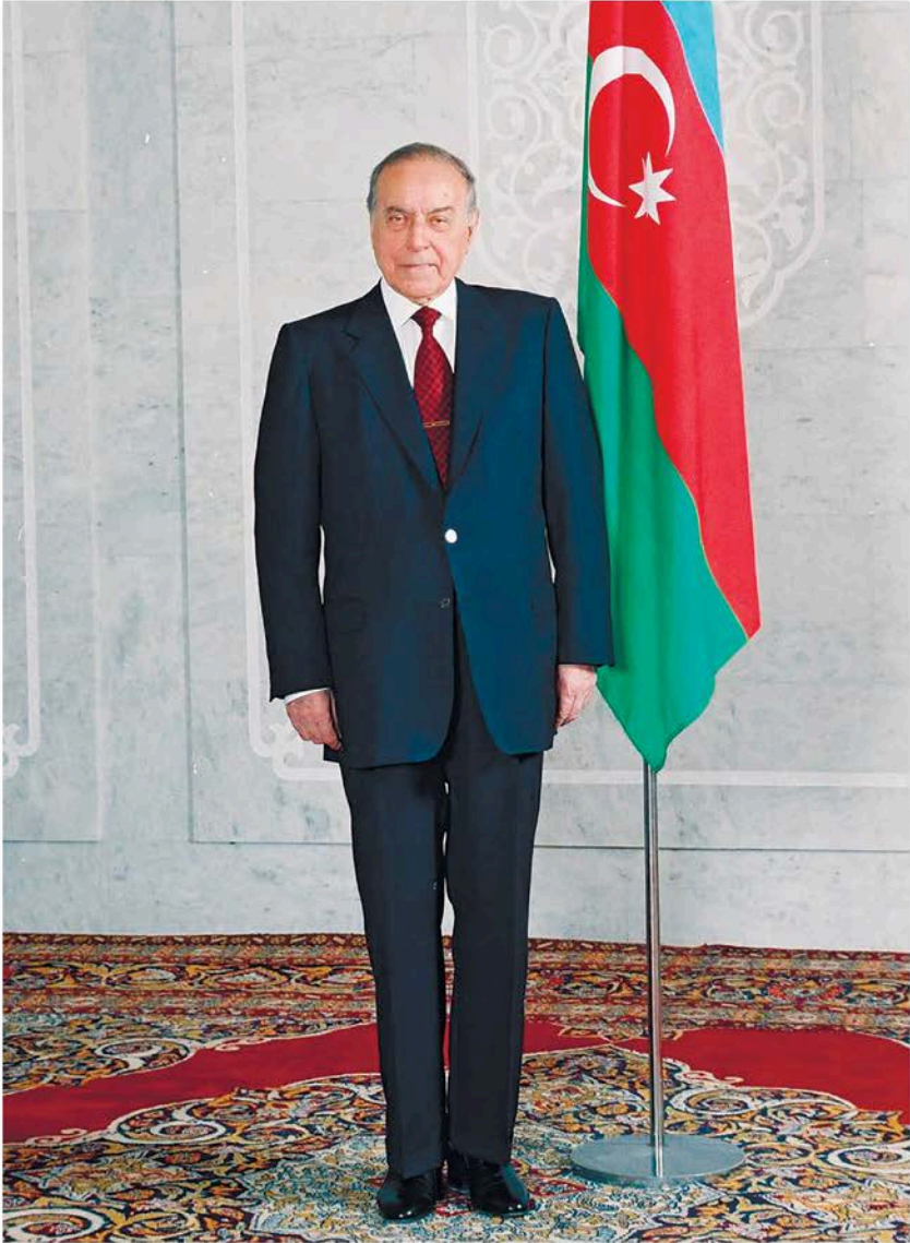
Azərbaycan xalqının ümummilli Lideri Heydər Əliyev