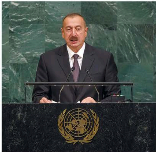
İlham Əliyevin BMT-də çıxışı

Azərbaycan Respublikasının Prezidenti İlham Əliyev bundan sonra da səbr və dözümlü nümayiş etdirərək beynəlxalq təşkilatların iclaslarında, o cümlədən, Soçi şəhərində, Qazaxstanda eləcə də sonuncu dəfə isə Almaniya-