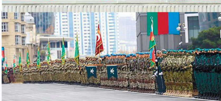
8 Noyabr Zəfər Paradı