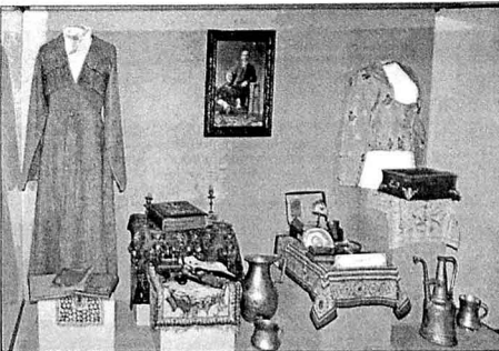
Nizami Gəncəvi adına Ədəbiyyat Muzeyində Firdin bəy Köçərlin qışası

...Bu halda hətta millətin dərşinin soydan adamları da millətpərəstlikdən