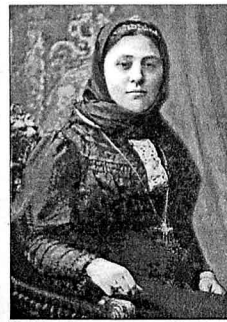
Badısəbə xanım Nizami Gəncəvi adına Ədəbiyyat Muzeyinin kolleksiyasından

Onların bir yerdə oldular istə yuvanın dağıdılar.