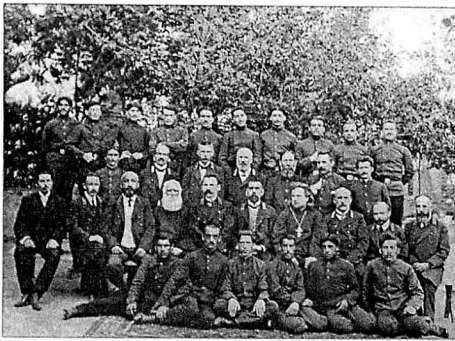
Firdun bəy Köçərlə Qori seminariyasında. İkinci sıra, sağdan üçüncü Nizami Gəncəvi adına Odebiyyat Muzeyinin kolleksiyasından