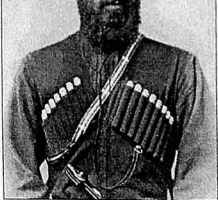
Firdin bəy Nizami Gəncəvi adına Ədəbiyyat Muzeyinin kolleksiyasından

"Əməkdar müəllim" də oldu, "Şərəf nişanı" ordeniylə də təltif edildi.