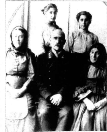
Ailə üzvləri ilə

Qeyd edim ki, 1965-ci il yanvarın 1-dən Mədəniyyət Nazirliyinin qərarı ilə kitabxanamız Firidun bəy Köçərlinin adını daşıyır. F.Köçərli adına uşaq kitabxanası olaraq bu sahədə üzərimizə çox mühüm vəzifələr düşür. Bizim ən ümdə vəzifəmiz böyük adibimizi oxucularımıza tanımaq, onun dəyərli əsərlərini onlara sevdirməkdir. Çünki ulu öndər Heydər Əliyevin söylədiyi kimi kitabxana məbədgahdır, hər bir ziyalının yolu bu məbədgahdan keçir. Balacaları vətənpərvərlik, humanizm, düşmənə nifrət, beynəlmillətlik ruhunda tərbiyə etmək üçün biz kitabxanacılar çox çalışmalıyıq. Biz inanırıq ki, illər ötsə