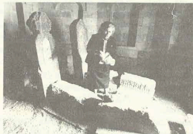
Özizə Cəfərzadə Nəsiminin qəbri üstündə (1988)

Deyəsən, arzu-kamıma çatdıqdan sonra başım ayıldı və ətrafıma baxmağa başladım. Bir qadın, bir ana, bir qadınlar şurası nümayəndəsi kimi, əlbəttə, birinci növbədə hələbli,