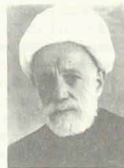
Hacı Şeyx Fərəcullah Zeynalabdin oğlu Pişnamazzadə

malarımız kimi bu məktublarda da taleyi beləcə olub, hələ lazımınca əldə edilib tədqiq olunmayıb.