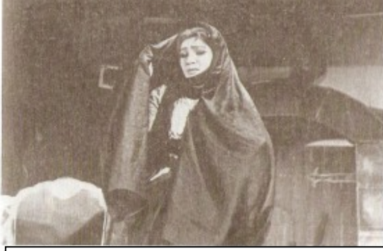
Ə. Haqverdiyevin "Dağılan tifaq" pyesindən bir səhnə