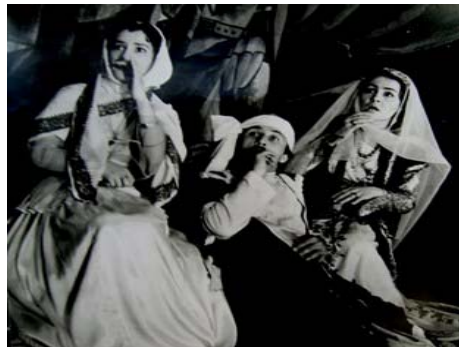
Ə. Haqverdiyevin “Pəri-cadu” pyesindən bir səhnə