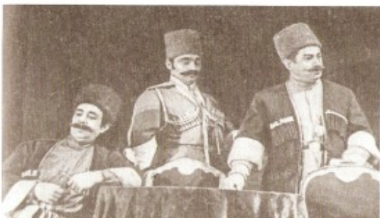
Ə. Haqverdiyevin “Dağılan tifaq” pyesindən bir səhnə