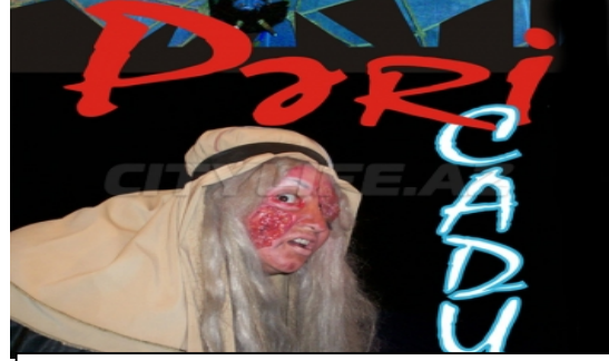
Pəri-cadu əsərinin uşaqlar üçün hazırlanmış tamaşasından bir səhnə

Kitabxanalarda oxucular arasında onların Əbdürrəhim bəy Haqverdiyevlə bağlı fikirlərini öyrənmək məqsədilə anket sorğuları təşkil edə bilərik. Sorğuda təqdim olunan sualların cavablarını açıq və qapalı təqdim edirik ki, oxucular öz fikirlərini rahatca ifadə edə bilsinlər: