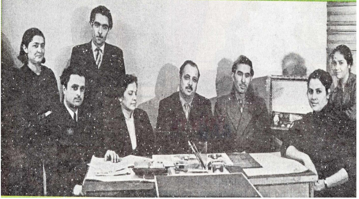
“Göyərçin” jurnalının 40 illik yubileyi münasibətilə jurnalın əməkdaşları: