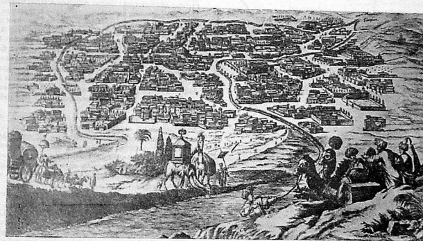
Эрдәбил XVII әсрдә (О. Дапперин әсәриндәки рәсм).

Эрдәбил Азәрбајчанын эн гәдим, зәккин тәрихли шәһәрләриндәндир. Археоложи газытлыр һэлэ күч дөврүндә онун әрәзиндә јашайыш мөскөннин олдуғуну әјдиһлашдырмышдыр. Шәһәр Мәркәзи Азәрбајчанын олдуғча кәзәл, сәфәлы вэ мәнсүләр бир бөлкәсиндә салынышдыр.