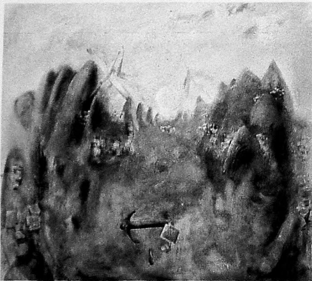
Ф. Һашымов. «Мәним Шаһбузум».