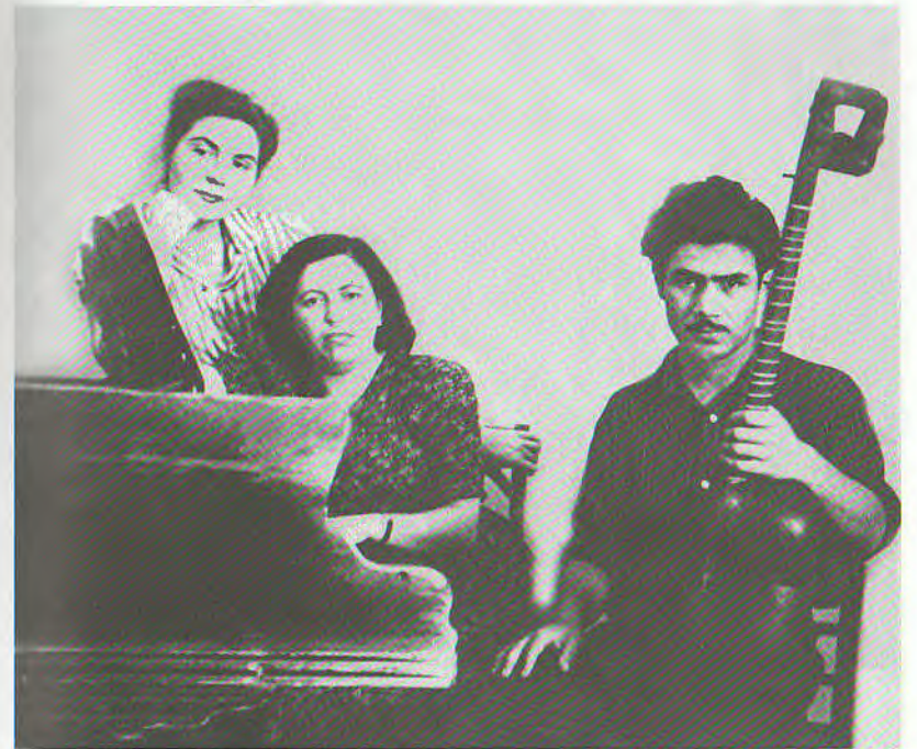
Ağabacı Rzayeva musiqi texnikumunda dərslər zamanı, 1954-cü il