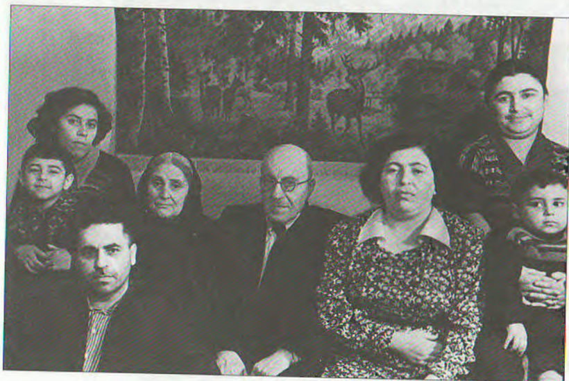
Ağabacı Rzayeva ailə üzvləri arasında, 1956-cı il