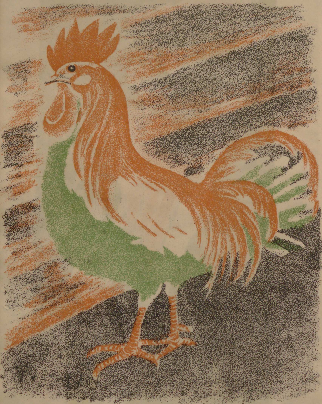
Хоруз учду кардага.