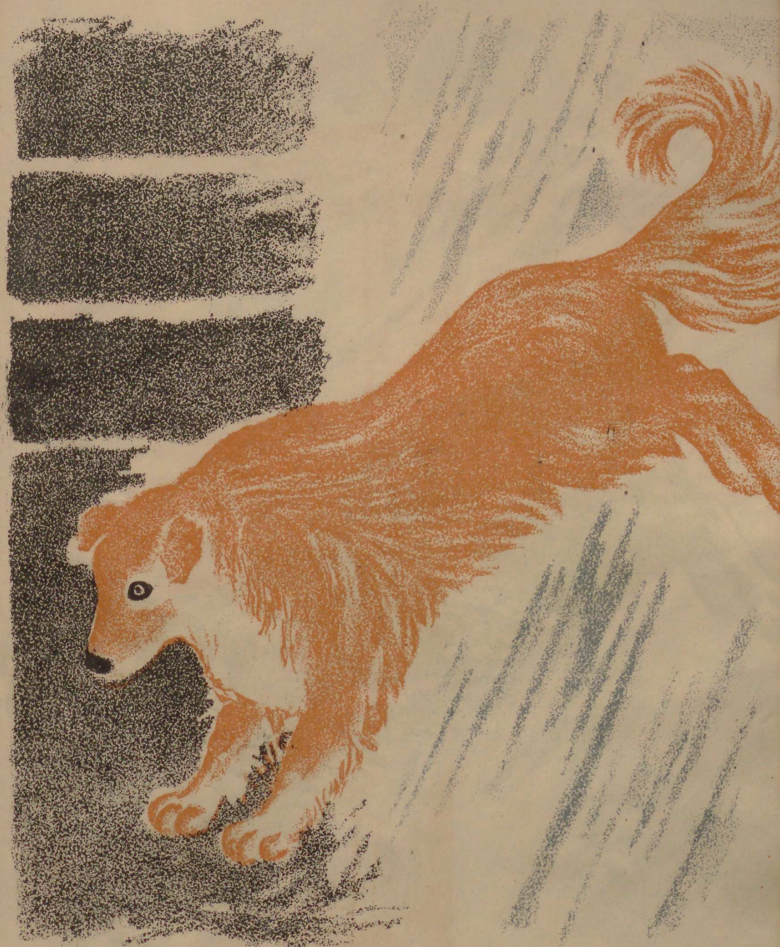
Көрөк атыды вага.