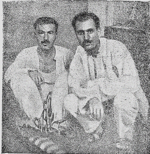
Солдан: Ираг ҚП-нин баниси Фәһд вә МҚ-нын үзвү Зәки Бәсим

Халг илә ачыг-ачыға мұбаризәдән горхан чәлладлар өз мурдар пәнчәләриндә олан душтаглара диван тутмаға башладылар. Зинданда олан коммунист рәһбәрләри — Фәһд вә јолдашларыны өлүмә мәһкүм етдиләр. Бу мәһкәмәјә Лондондан хусуси «мәсләһәтчи» чағырмышдылар. Анчаг бу да онлара көмәк едә билмәмиш, мәһкәмәдә мүтәһимләр өзләри иттиһамчы олмушдулар.