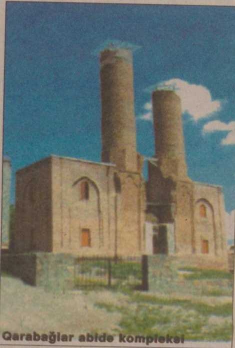
Qarabağlar abidə kompleksi

Qeyd edək ki, türbənin üzərindəki kitabə onun tikilmə tarixini təsdiqləyir. Həmin kitabə türbənin hicri 557-ci ilin şəvval ayı (miladi 1162) tikildiyini bildirir. Əsas fəsadın sol tərəfdəki kitabədə isə «Bəna Əcəmi Əbubəkr oğlu Naxçıvaninin əməlidir» sözləri qeyd olunub.