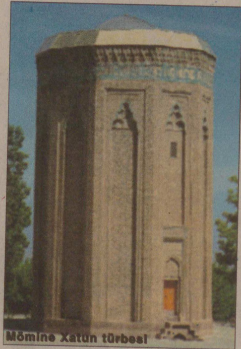
Möminə Xatun türbəsi

Mədəni irs siyahısına salınması nəzərdə tutulan digər abidə isə Culfa rayonu yaxınlığında yerləşən Gülüstan türbəsidir. Abidə Araz çayının sahilində sərhədə yaxın yerdə tikilib. Türbənin digər abidələrdən fərqli olaraq kərpicdən deyil, daşdan tikildiyini deyən mütəxəssis onun Türkiyənin ərəzində olan Səlcuq sülaləsi dövrünə aid kiçik türbələrə bənzədiyini bildirdi: «Abidə XIII əsrdə Möminə Xatun türbəsinin təsiri altında inşa olunub və Azərbaycanın qülləvari türbələri qrupuna daxildir. Türbənin 12 üzlü gövdəsi qırmızı qumdaşından, orijinal quruluşlu kürsülü (kürsüləri kəsilmiş kub formasındadır) isə yonulmuş daşdan tikilib. Azərbaycanın digər türbələrindən fərqli olaraq, Gülüstan türbəsinin sərdabəsi yerüstü hissədə (kürsülü) yerləşir. Kürsülük xaricdən kəşik piramida,