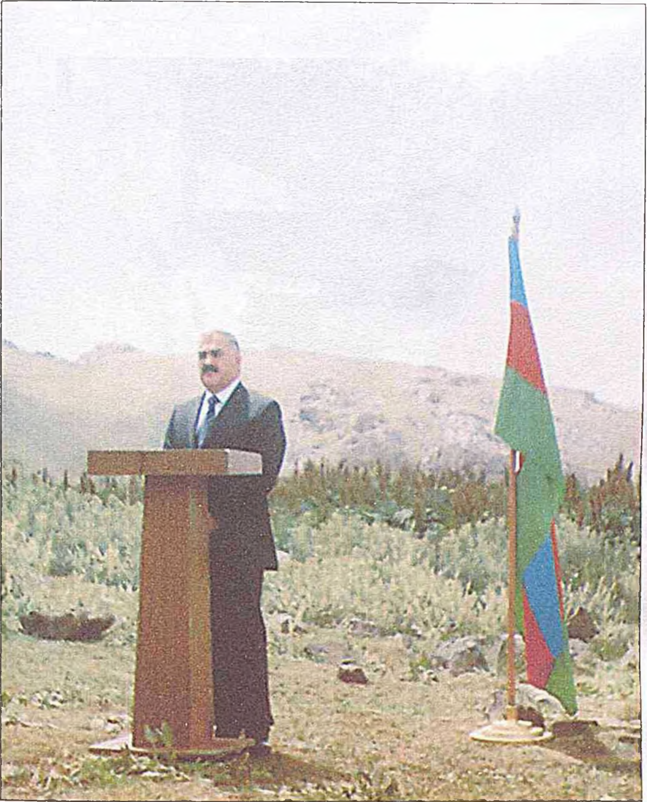
Naxçıvan Muxtar Respublikası Ali Məclisinin Sədri Vasif Talibov Gəmiqayada keçirilən beynəlxalq konfransda çıxış edərkən.