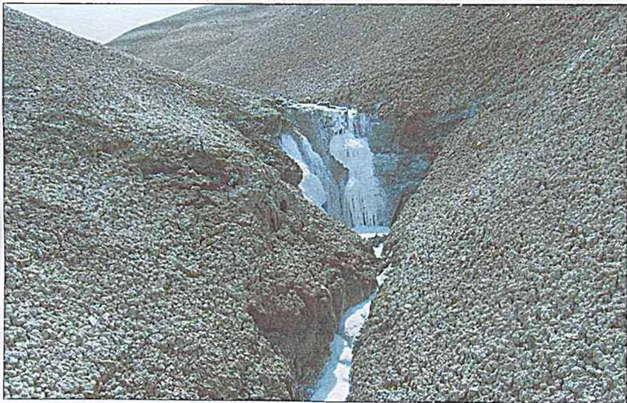
Duzdağ. Təbbi duz axını-“duz çayı”