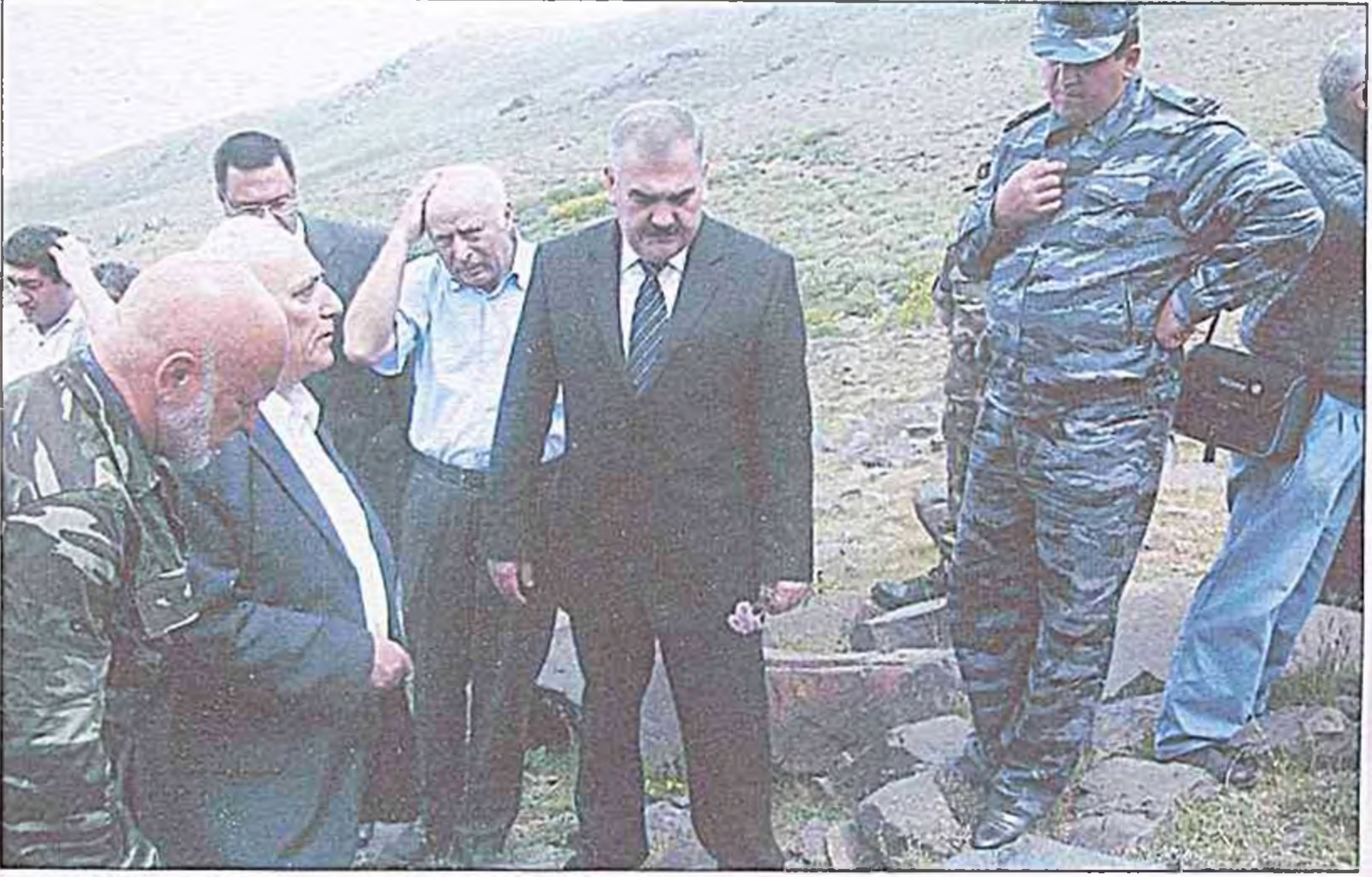
Yeni tapıntılarla bağlı elmi müzakirə.