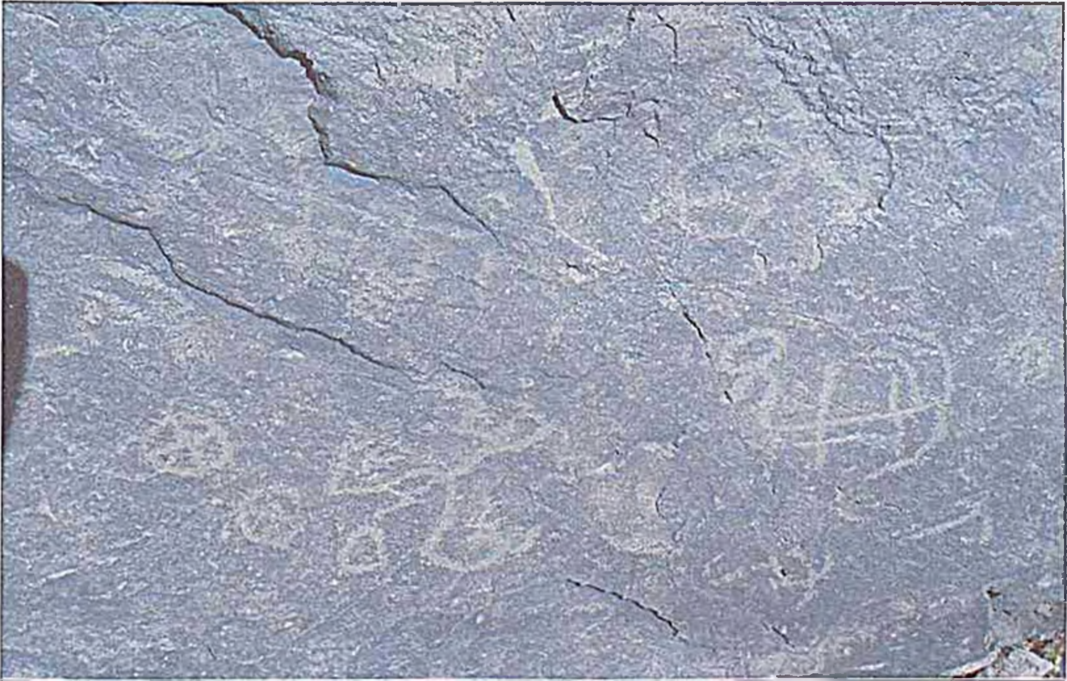
Gəmiqayada sxematik gəmi və qaranquş təsviri