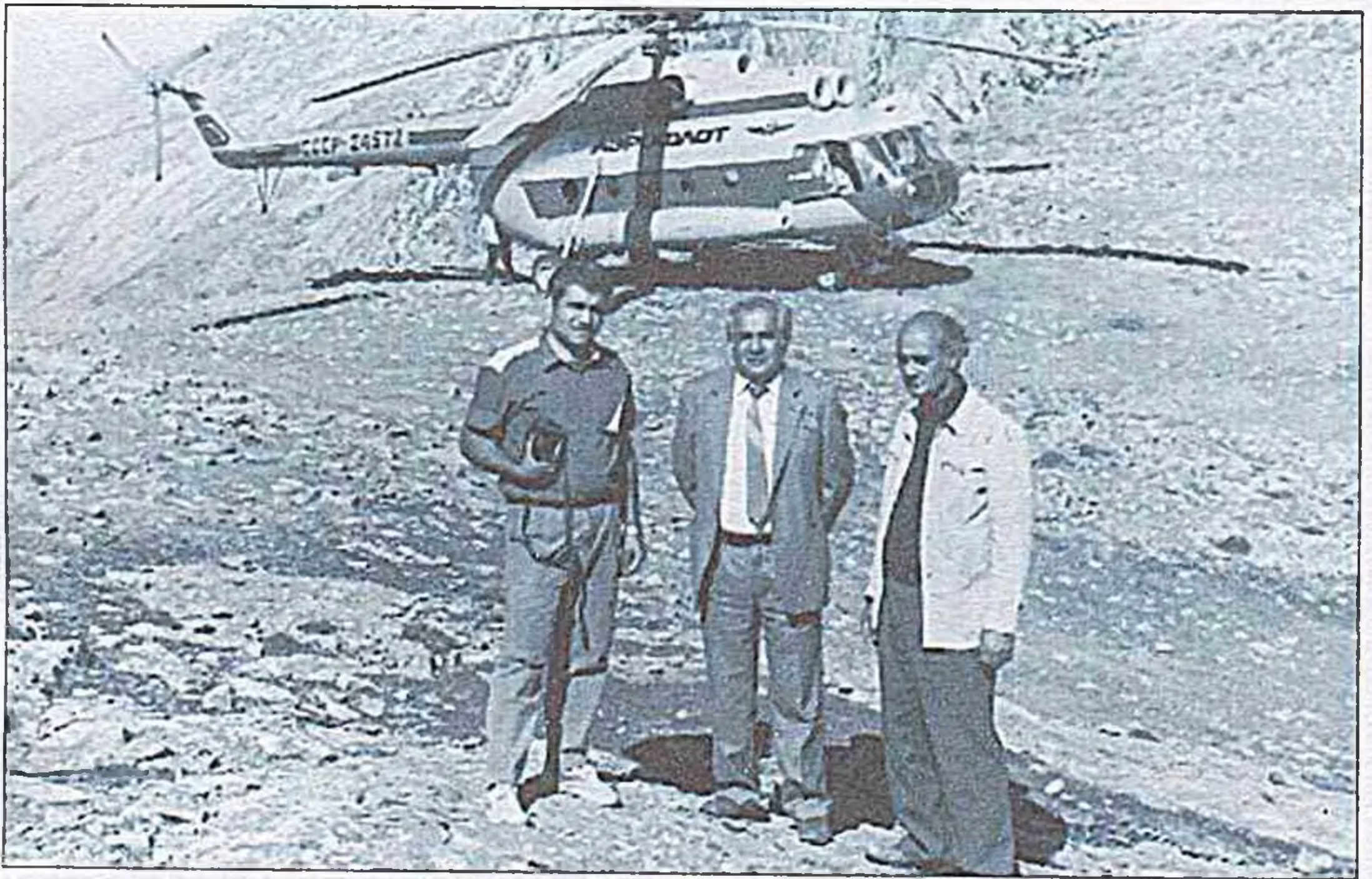
1989-cu ildə Gəmiqayada olarkən