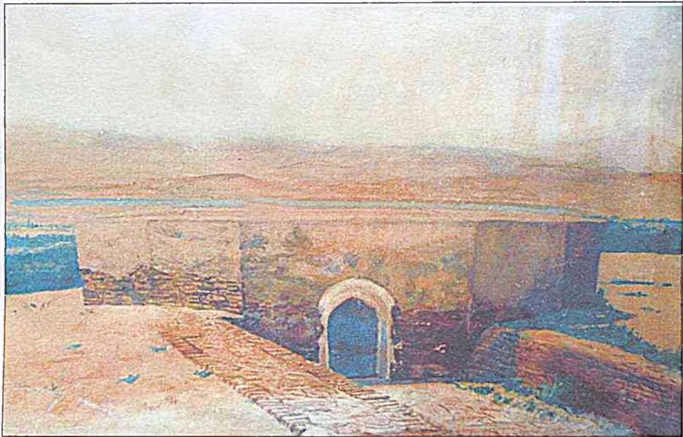
Bəhrüz Kəngərli : “Nuhun türbəsi” tablosu, 1916