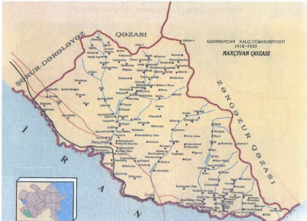
Azərbaycan Xalq Cümhuriyyəti (1918-1920-ci illər). Naxçıvan qəzası.