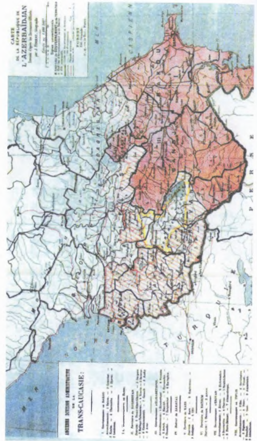
Azərbaycan nümayəndə heyətinin Paris Sülh konfransına təqdim etdiyi xəritə. İyun 1919-cu il