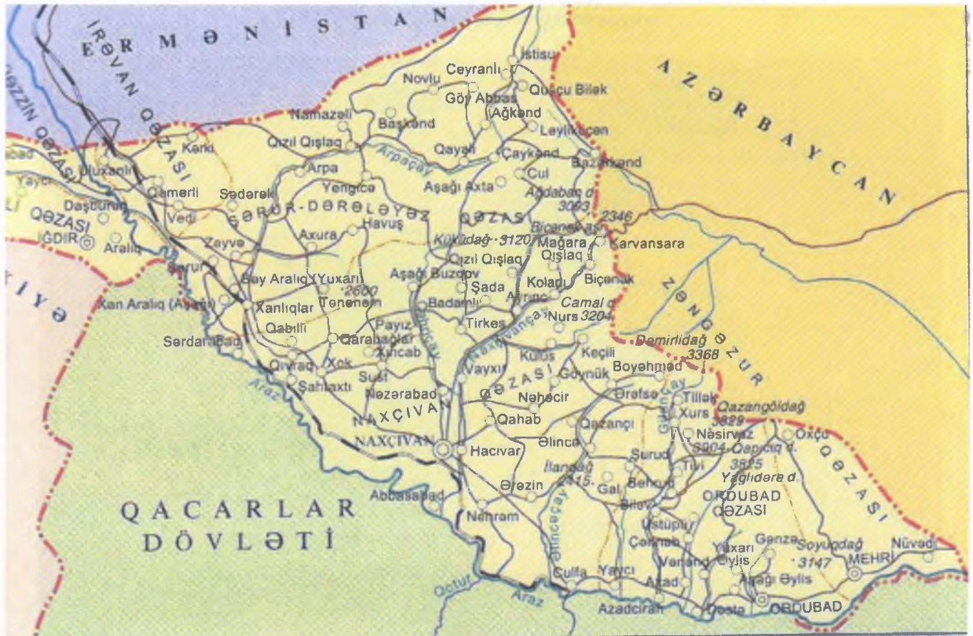
Naxçıvan Araz-Türk Respublikası (noyabr 1918 – mart 1919)