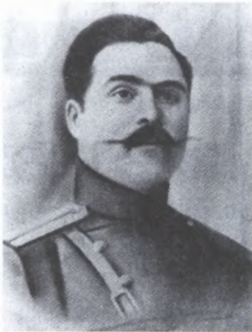
Polkovnik İbrahim bəy Qədimov