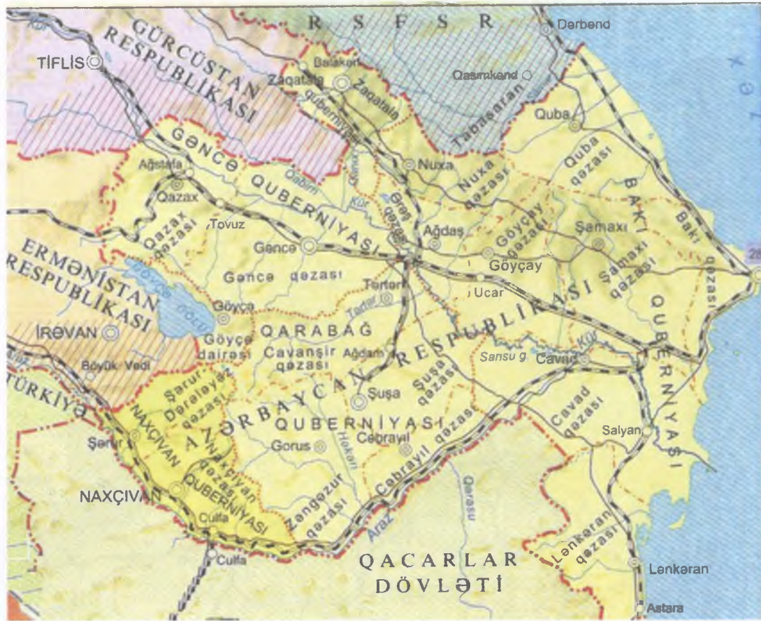
Naxçıvan Azərbaycan Xalq Cümhuriyyəti dövründə (1918-1920-ci illər)