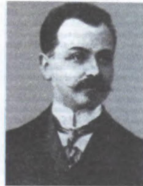
Fətəli xan Xoyski. Nazirlər Şurasının sədri (1, 2, 3-cü kabinetə)