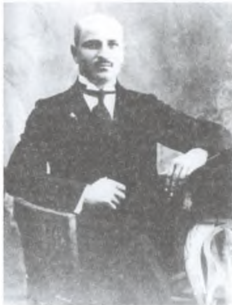
Məmməd Yusif Cəfərov. Azərbaycan Xalq Cümhuriyyətinin IV hökumət kabinetində xarici işlər naziri