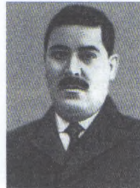
Behbud ağa Şahtaxtinski