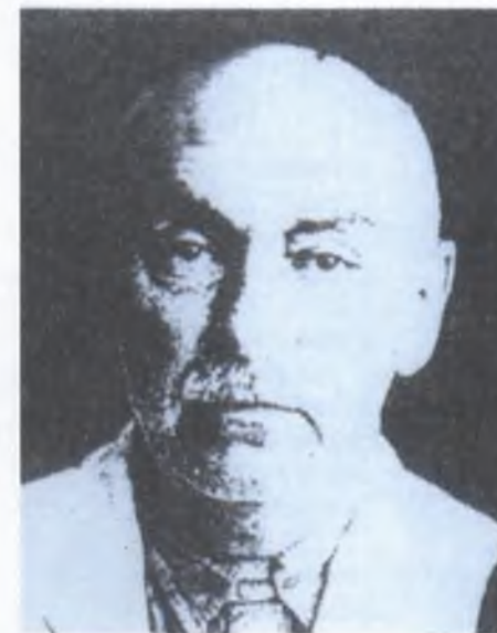
Əkbər xan Naxçıvanski