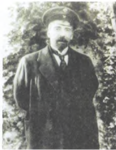
Məmməd Həsən Hacinski. Azərbaycan Xalq Cümhuriyyətinin ilk xarici işlər naziri