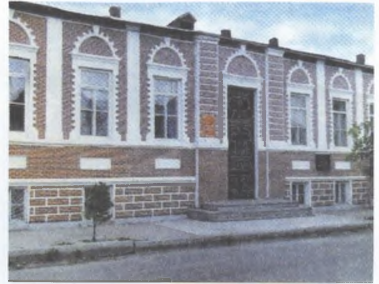
Naxçıvan şəhərində Araz-Türk Respublikasının qərarqahının yerləşdiyi bina