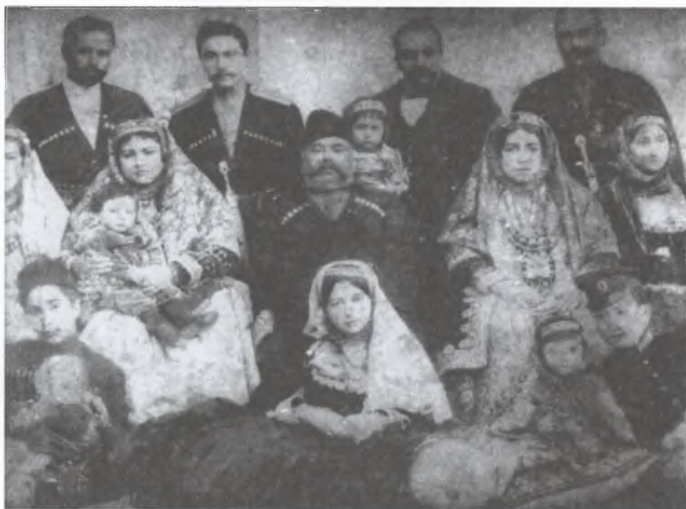
Yuxarıda sağdan 1-ci Cəfərqulu xan, 2-ci Rəhim xan, aşağıda sağdan 1-ci III Kalbali xan Naxçıvanski