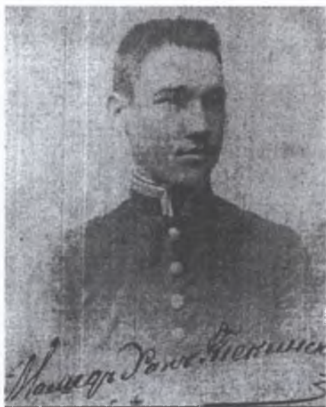
Məmməd xan Təkinski