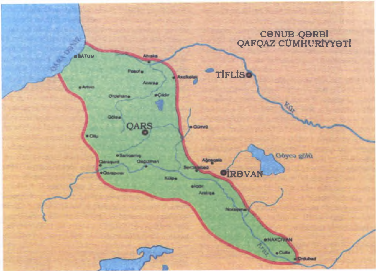
Cənub-Qərbi Qafqaz Respublikası (dekabr 1918-aprel 1919)