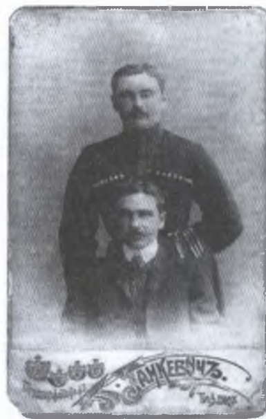
Bəhrəm xan və Kamran xan Naxçıvanski