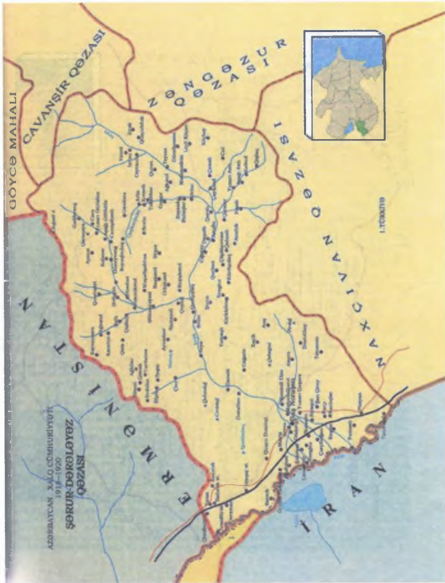
Azərbaycan Xalq Cümhuriyyəti (1918-1920-ci illər). Şərur-Dərələyəz qəzası.