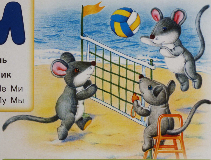
Мы-ши бро-са-ют мя-чик.