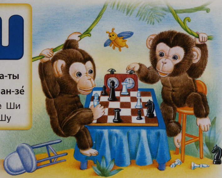
Шим-пан-зе́ иг-ра́-ют в ша́х-ма-ты.