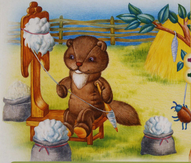
Нор-ка пря-дёт нит-ки.