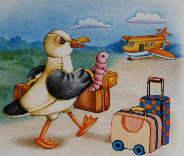
Ча́й-ка и чер-вя́к не-су́т че-мо-да́-ны.