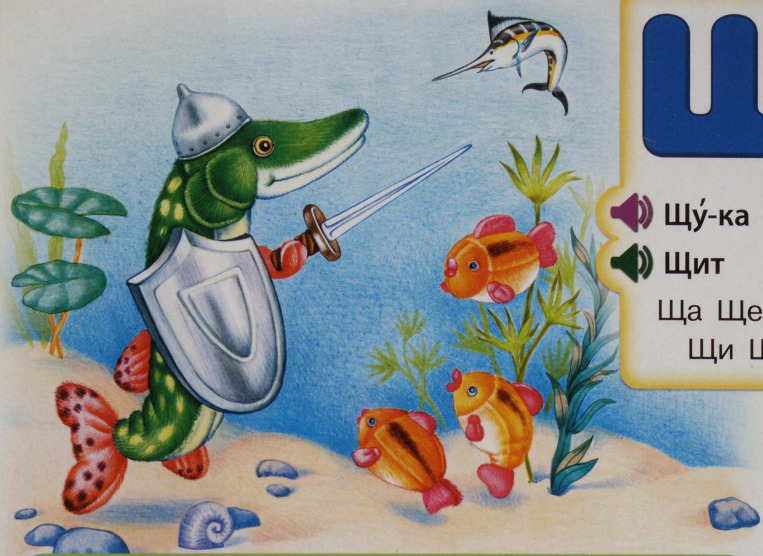
Щу́-ка де́р-жит щит.