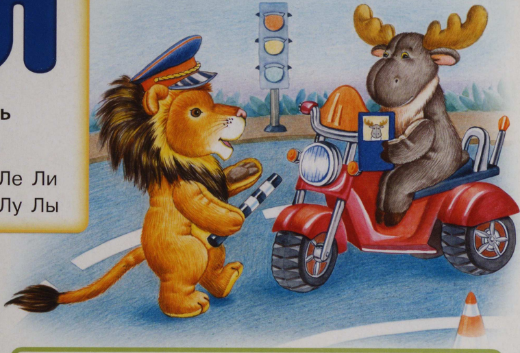
Лев о-ста-но-вил ло-ся.