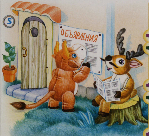
О-ле́нь и бык чи-та́-ют объ-яв-ле́-ни-я.