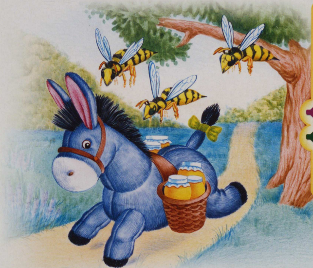
Ослик у-бе-га-ет от ос.