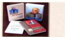
«Elçin» kitabı və qanunvericilik haqqında kitabın «Elçin» kitabı.