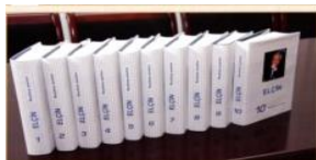
«Elçin» məlumatı, 2014-cü il.