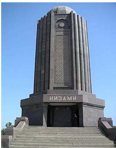
Nizami Gəncəvinin məqbərəsi

mineral su ehtiyatları ilə zəngin bölgə turizmin inkişafı baxımından perspektivlidir. Qədim tarixə malik bu şəhərdə hazırda 500-dən çox tarixi abidə, 217 qədim bina, 4 teatr, 5 muzey var və çoxlu sayda digər mədəniyyət obyektləri fəaliyyət göstərir. Nizami Gəncəvinin məqbərəsi, Cümə məscidi, İmamzadə tikililər kompleksi, Şeyx İbrahim məqbərəsi, karvansara və s. Gəncənin maraqlı turizm obyektləridir. Böyüklüyünə və iqtisadi əhəmiyyətinə görə respublikanın ikinci şəhəri olan Gəncənin cənubunda dəniz səviyyəsindən 1556 m yüksəklikdə yerləşən Göygölün ətrafında Göygöl və Hacıkənd istirahət zonaları, Göygöl DTQ yaradılmışdır. Göy Göl qoruğu ərazisində 423 növ ağac, kol, dərman bitkiləri var. Bunların 76 növü sırf ağac və koldur. Qalanları isə çəmən bitkiləridir. Ərazidə maral, cüyür, ayı, çöl qabanı, dağ keçisi, canavar, tülkü, çaqqal, porsuq, oxatan kirpi, çöl pişiyi, vaşaq kimi heyvanlar var. Bundan başqa ağ baş kərkəz, dağ hinduşkası və tetra kimi nadir quşlar da mövcuddur.