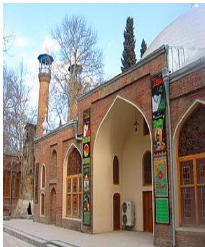
Şah Abbas (cümə)məscidi